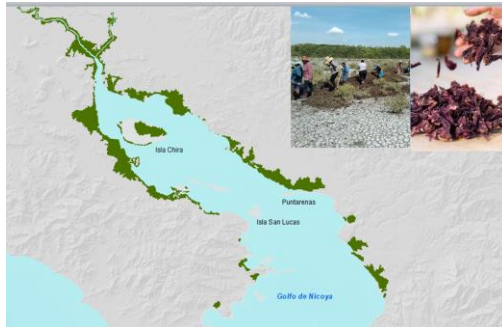
Modelo de mejora de pesquerías y acuicultura costera comunitaria

El tema de sostenibilidad, la idea es poder ayudar, un plan de mejora en temas de formación, administrativos, trabajamos en Chira, Tambor, San Juanillo y otros.